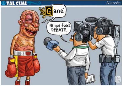
El Herald de México